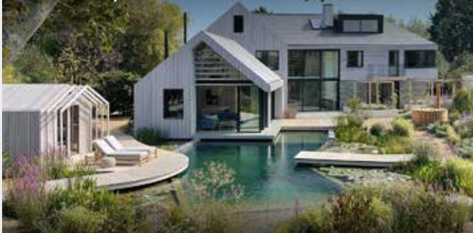
"The Grand Design House" i West Sussex, UK. Sioo:x-behandlad fasad och altan i lärk.

Efter ca 15 år, rengör ytan med SiOO:X Förtvätt och gör om hela behandlingen. För de mörkare nyanserna i SiOO:X Träskyddande Panelfärger, gäller kortare tid. Läs mer på sioox.se .